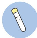
Un tubo de recogida (líquido conservante incluido)

Escriba su nombre y las fechas de nacimiento y recogida en formato MM/DD/AAAA en el área designada del tubo de recogida. ¡Ya estamos listos para comenzar el autoanálisis!